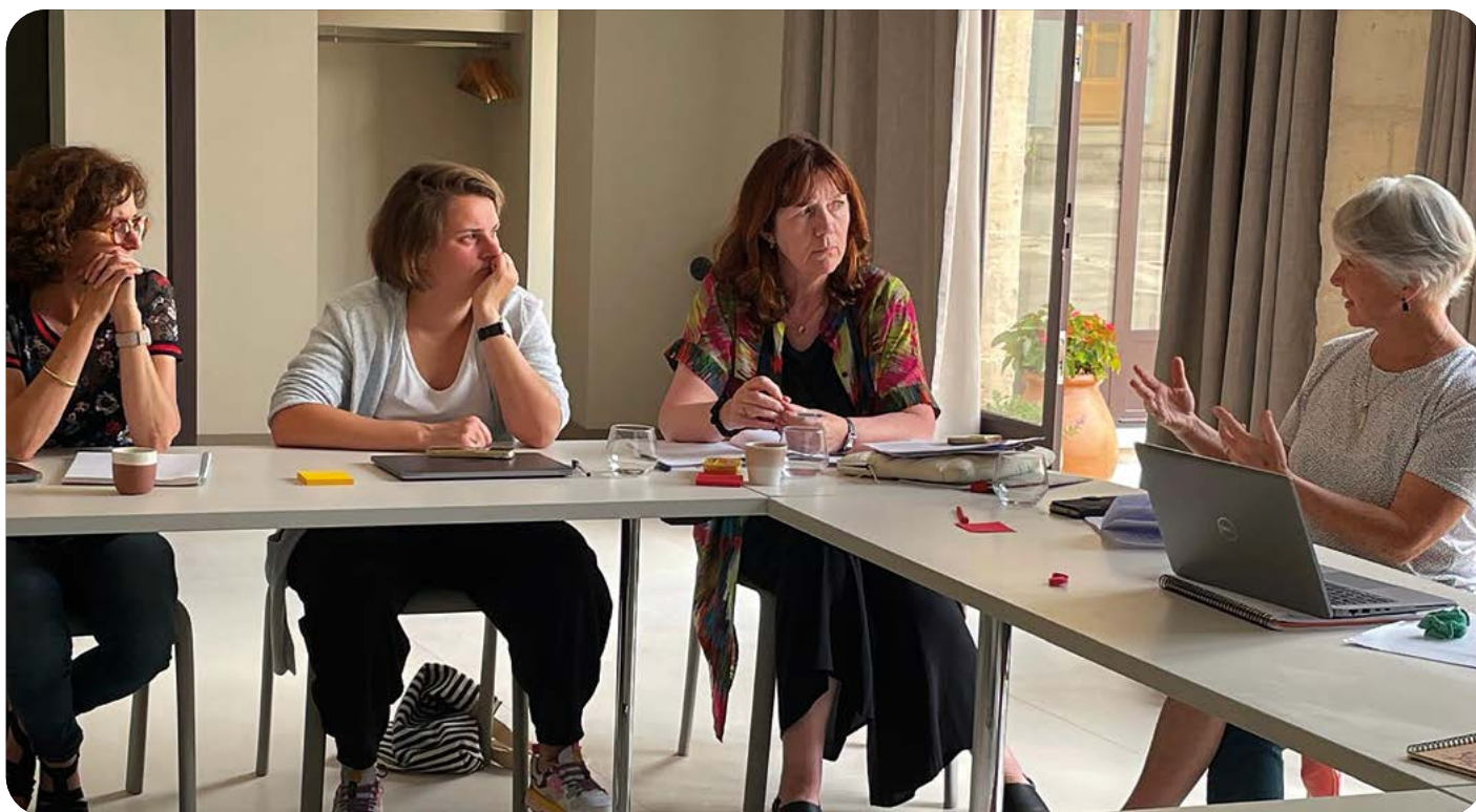
Travail d'intelligence collective à St-Rémy-de-Provence

La séance de travail dédiée à la construction de cet article s'est tenue au Mas Bellile, à Saint-Rémy-de-Provence, en juin 2025. L'article est actuellement en cours de soumission et sera diffusé en 2026.