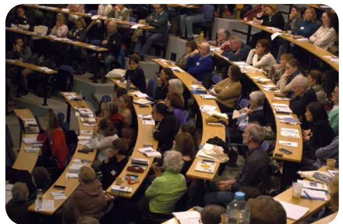
Participants lors des 2e Rencontres d'Aromathérapie Clinique, à Strasbourg, novembre 2025

Enfin, l'AFAC a organisé leur 2e édition des Rencontres d'Aromathérapie Clinique à Strasbourg. La Fondation a contribué à l'organisation de cet événement réunissant près de 200 participants.