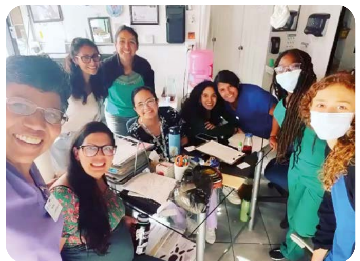
Groupe de bénévoles avec les femmes enceintes au camp de Tijuana

Ces femmes, majoritairement originaires d'Amérique centrale, vivent dans une situation d'extrême précarité, sans possibilité de franchir la frontière ni de retourner dans leur pays d'origine.