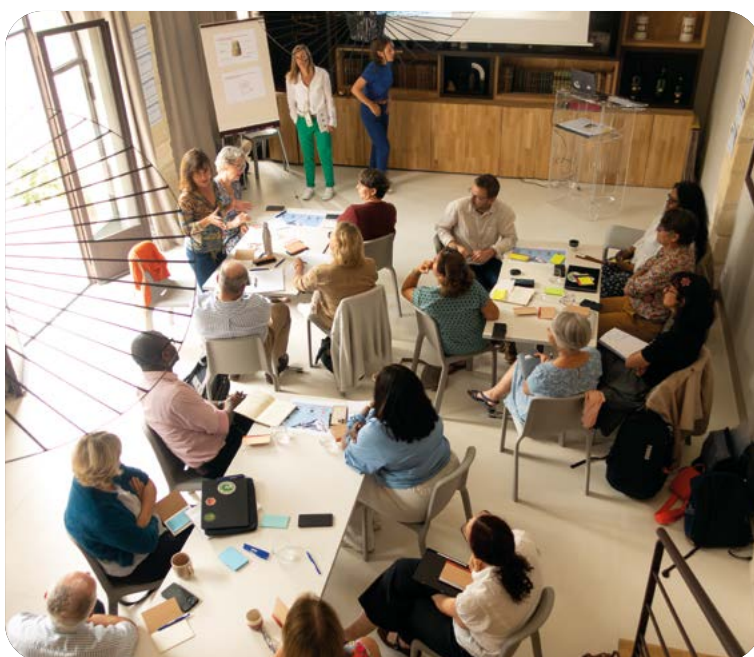
Session de travail en intelligence collective

Le cadre de travail, associé à des ateliers d'intelligence collective, a permis de structurer un collectif s'inscrivant dans une approche « One Health ». Leur ambition est de faire émerger des projets de recherche communs visant à évaluer le potentiel des huiles essentielles comme levier dans la lutte contre l'antibiorésistance.